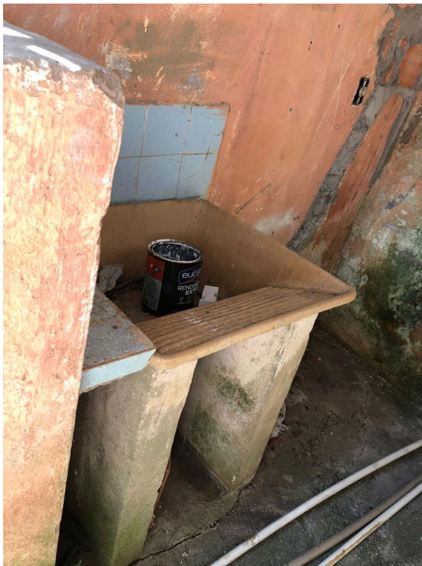
FOTO 37 – DETALHE DO TANQUE DA ÁREA DE SERVIÇO DO PAVIMENTO INFERIOR