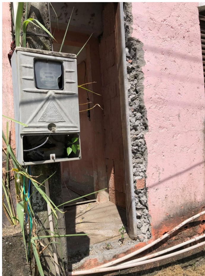
FOTO 35 – PADRÃO DE ENTRADA DE ENERGIA DO PAVIMENTO INFERIOR PELA RUA TEODORO FERREIRA MACHADO