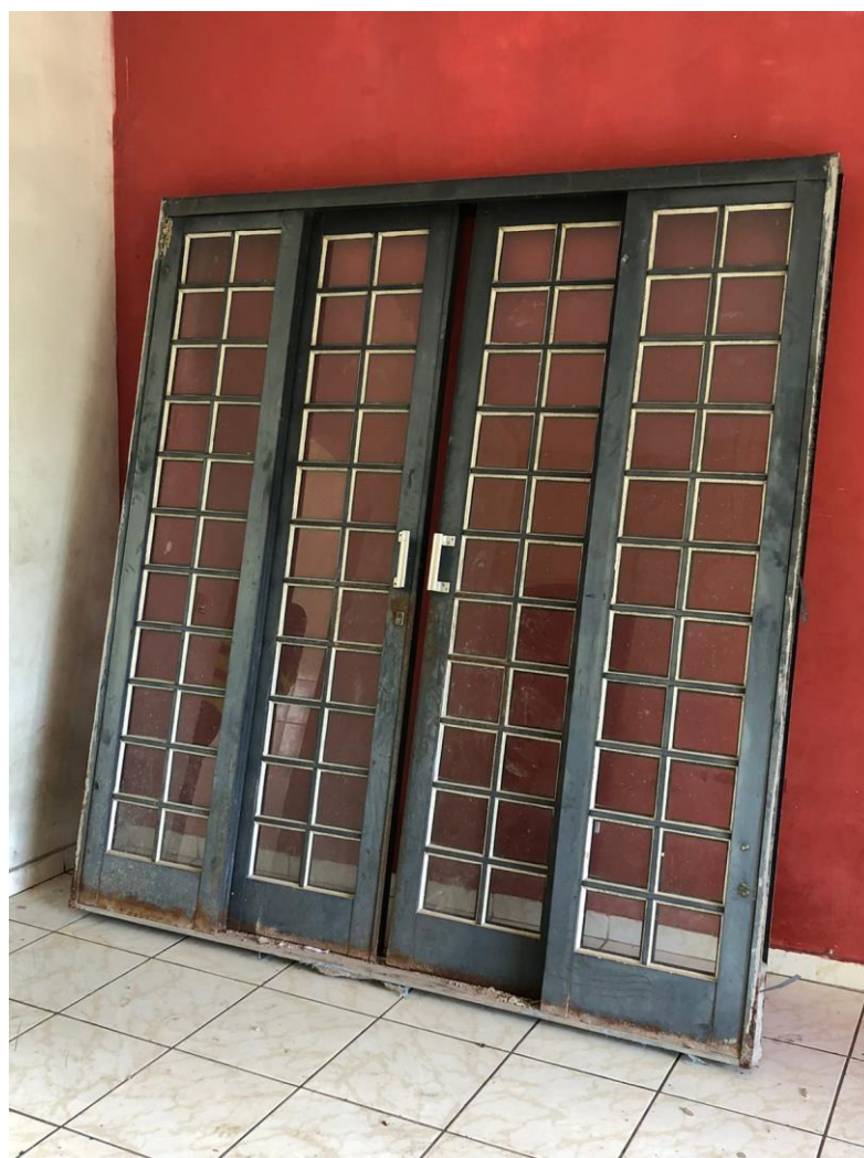
FOTO 22 – PORTA DE AÇO RETIRADA DA SALA DE ESTAR DO PAVIMENTO SUPERIOR