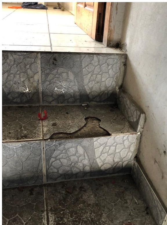
FOTO 18 – DETALHE DA AVARIA DO REVESTIMENTO DA ESCADA DE ACESSO AO PAVIMENTO SUPERIOR