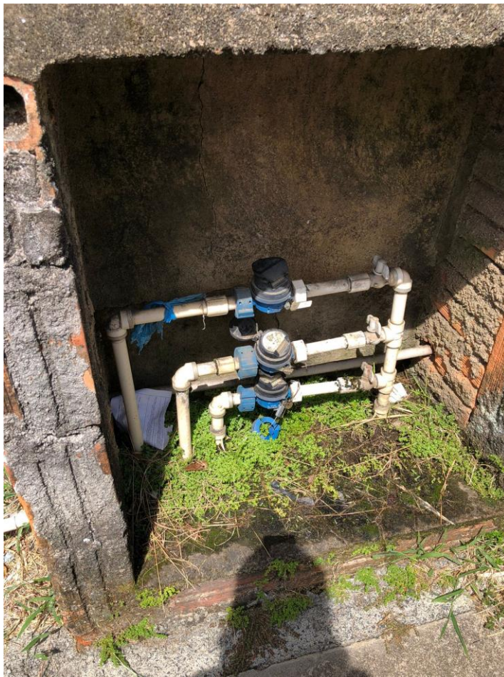
FOTO 41 – CONJUNTO DE HIDRÔMETROS DE ABASTECIMENTO DE ÁGUA DA EDIFICAÇÃO