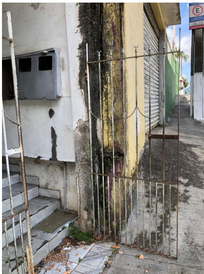
FOTO 04 – PORTÃO DE ACESSO AO PAVIMENTO TÉRREO E SUPERIOR PELA RUA IRMÃ CARMELA TESSAROLI