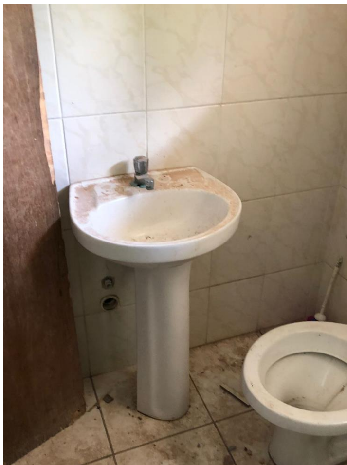
FOTO 28 – DETALHE DO LAVATÓRIO DO BANHEIRO SOCIAL DO PAVIMENTO SUPERIOR