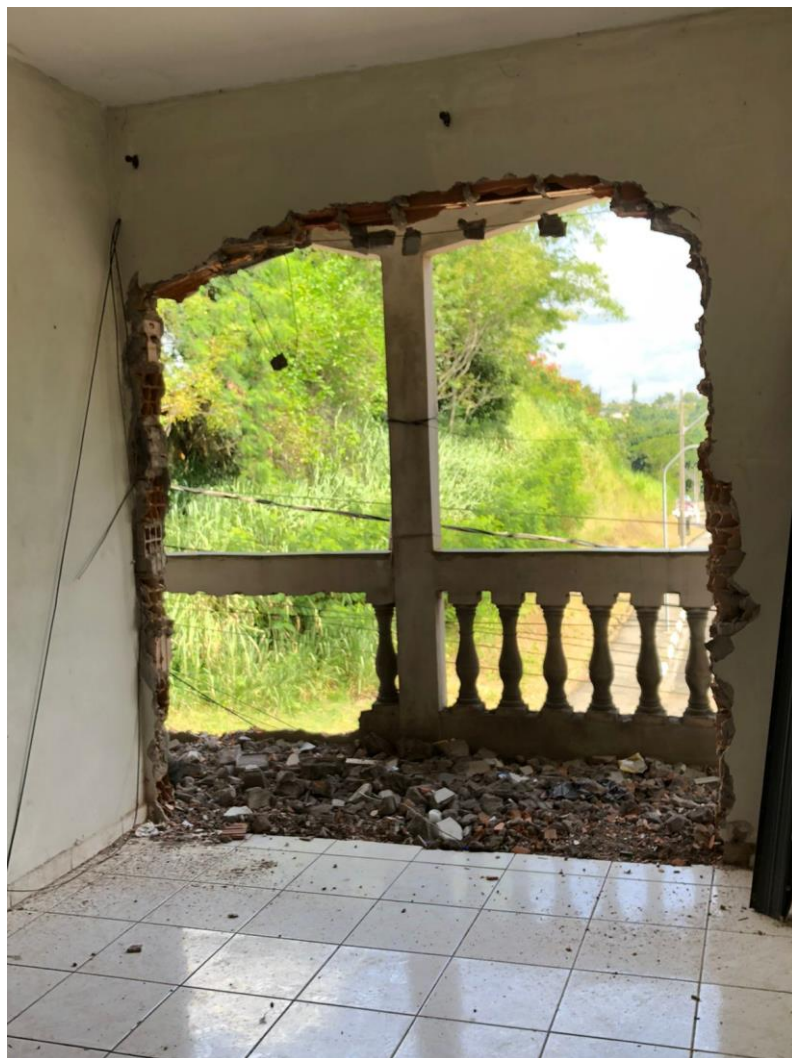
FOTO 23 – DETALHE DA SALA DE ESTAR DO PAVIMENTO SUPERIOR ONDE FOI RETIRADO UMA PORTA DE AÇO