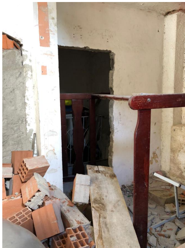
FOTO 50 – ABERTURA ENTRE A GARAGEM E SALA 02 DO PAVIMENTO INFERIOR