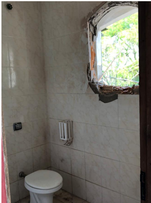
FOTO 29 – ABERTURA DA JANELA DO BANHEIRO SOCIAL DO PAVIMENTO SUPERIOR